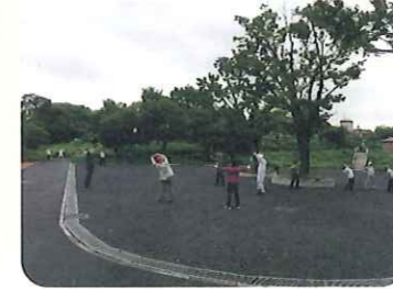
毎朝のラジオ体操