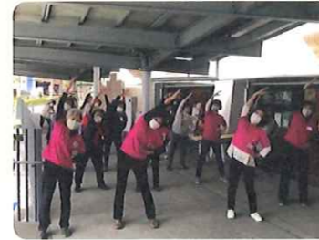
洋光台フィットネス